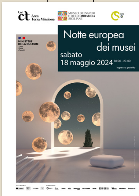
NOTTE EUROPEA DEI MUSEI 18.05.2024