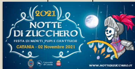
NOTTE DI ZUCCHERO 02.11.2021