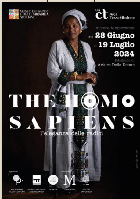
THE HOMO SAPIENS 28.06.2024 | 19.07.2024