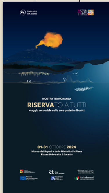
RISERVATO A TUTTI 01.10.2024 | 31.10.2024