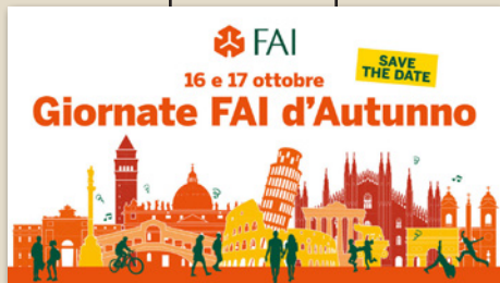
GIORNATA FAI D'AUTUNNO 16.10.2021 | 17.10.2021