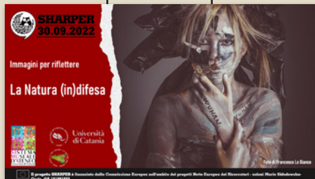
LA NATURA (IN)DIFESA 30.09.2022 | 05.12.2022