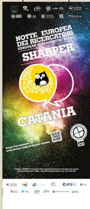
SHARPER NIGHT 29.09.2023