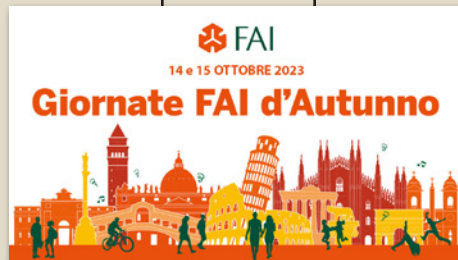
GIORNATA FAI D'AUTUNNO 14.10.2023 | 15.10.2023