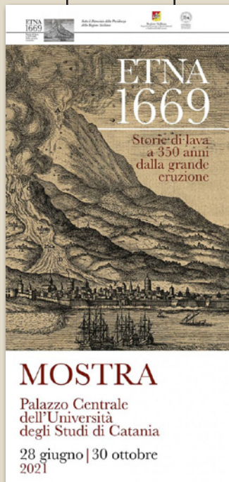
ETNA 1669 28.06.2021 | 30.10.2021