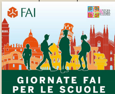
GIORNATE FAI PER LE SCUOLE 20.11.2023 | 23.11.2023