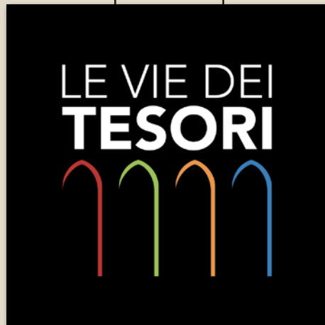
LE VIE DEI TESORI 09.10.2021 | 16.10.2021