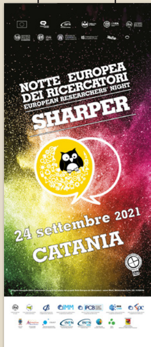
SHARPER NIGHT 24.09.2021