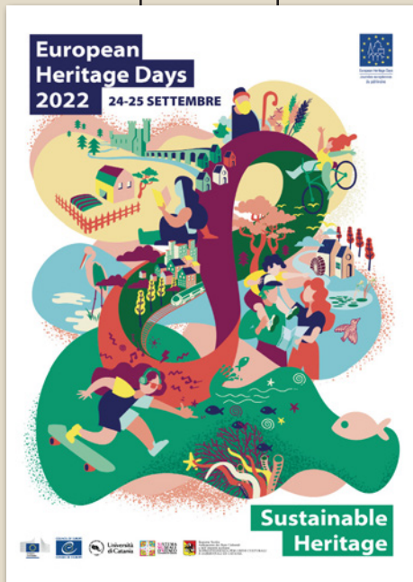
EUROPEAN HERITAGE DAYS 24.09.2022 | 25.09.2022