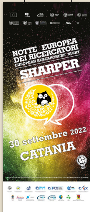
SHARPER NIGHT 30.09.2022