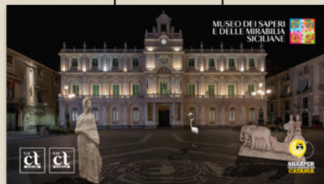
SHARPER NIGHT 27.09.2024