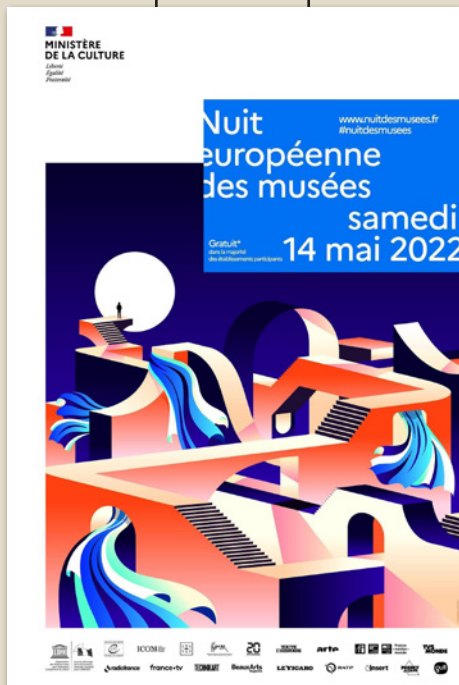
NOTTE EUROPEA DEI MUSEI 14.05.2022