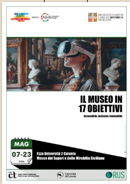
IL MUSEO IN 17 OBIETTIVI 07.05.2024|23.05.2024