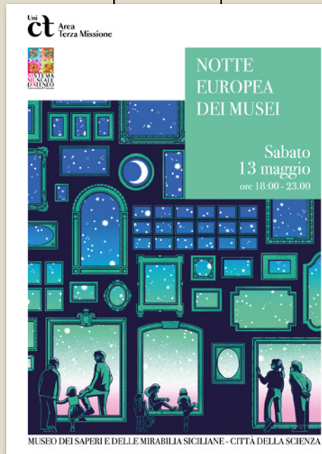
NOTTE EUROPEA DEI MUSEI 13.05.2023