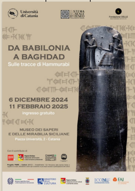
DA BABILONIA A BAGHDAD 06.12.2024 | 11.02.2025