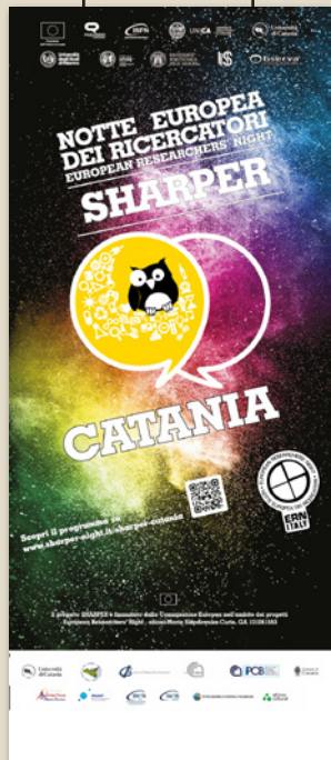
SHARPER NIGHT 29.09.2023