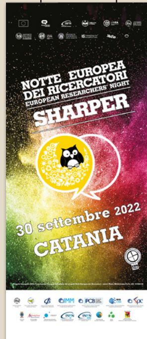
SHARPER NIGHT 30.09.2022