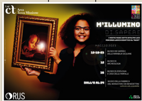
M'ILLUMINO DI SAPERE 12.05.2023 | 23.05.2023