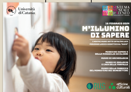
M'ILLUMINO DI SAPERE 16.02.2024