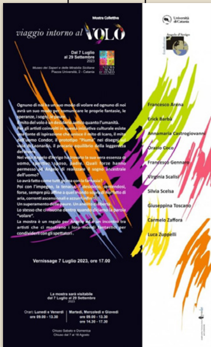
VIAGGIO INTORNO AL VOLO 07.07.2023 | 29.09.2023