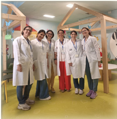
il Museo delle Mirabilia va in Pediatria