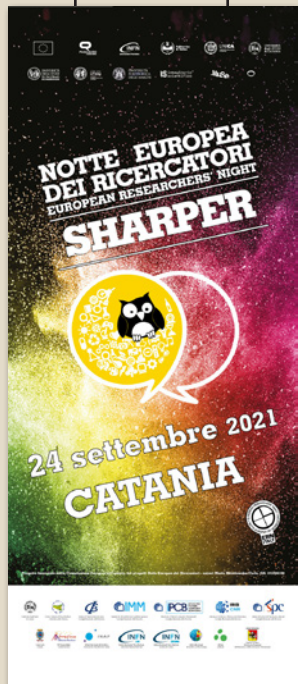
SHARPER NIGHT 24.09.2021