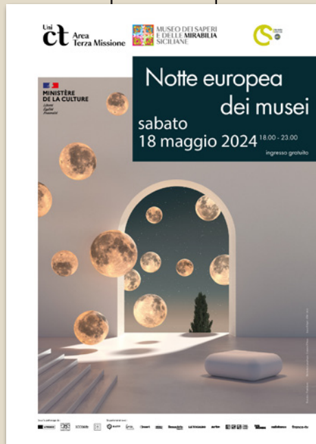
NOTTE EUROPEA DEI MUSEI 18.05.2024