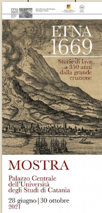
ETNA 1669 28.06.2021 | 30.10.2021