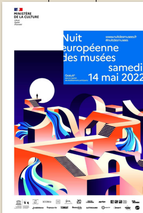
NOTTE EUROPEA DEI MUSEI 14.05.2022