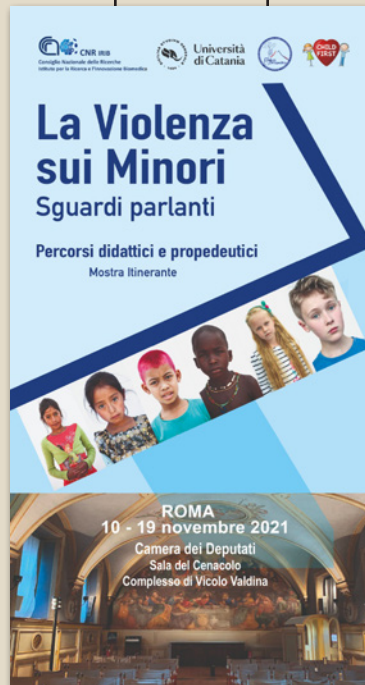
LA VIOLENZA SUI MINORI 10.11.2021|19.11.2021