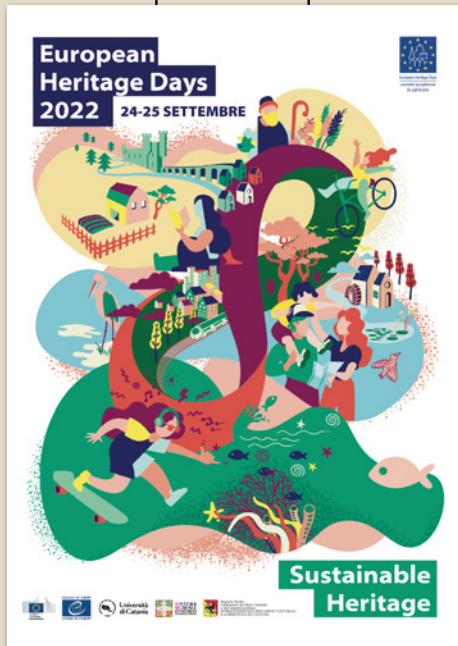
EUROPEAN HERITAGE DAYS 24.09.2022 | 25.09.2022