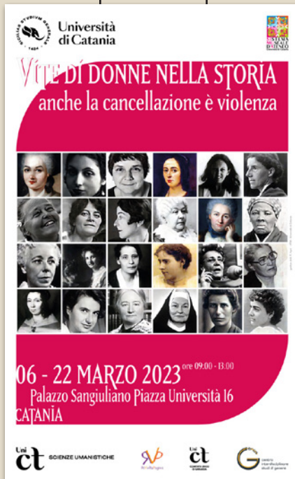
VITE DI DONNE NELLA STORIA 06.03.2023 | 22.03.2023