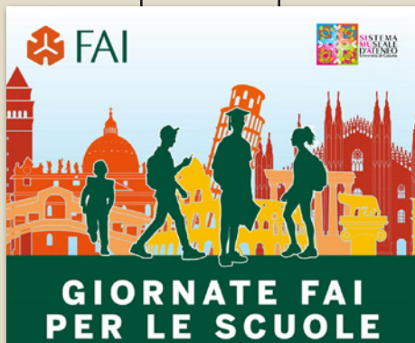
GIORNATE FAI PER LE SCUOLE 20.11.2023 | 23.11.2023