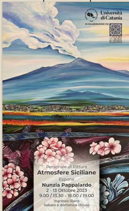
ATMOSFERE SICILIANE 02.10.2023 | 13.10.2023